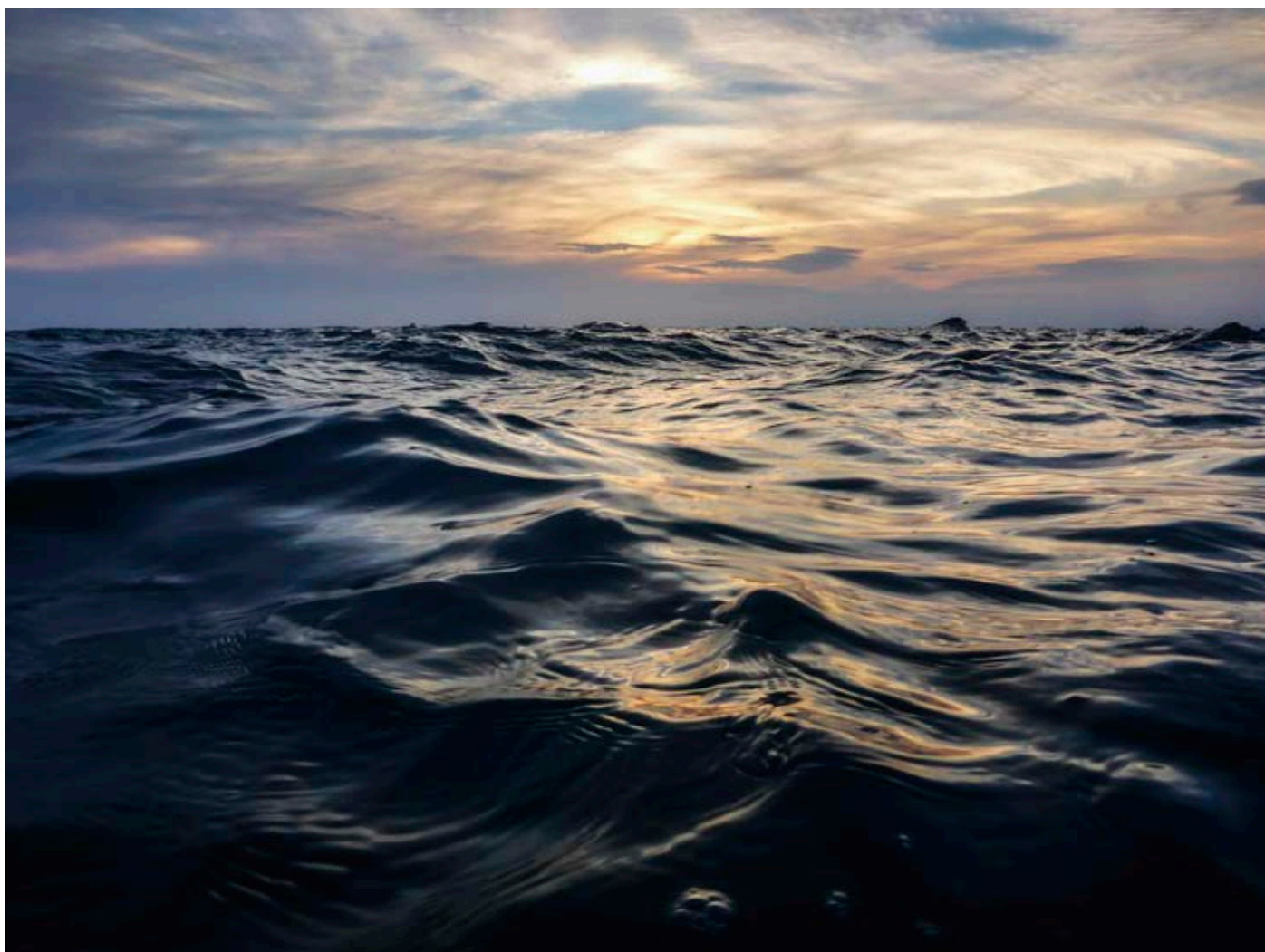
Mi playa (2014, Cabo de Gata. 127 x 95)

Treinta años en Madrid y sigo añorando el mar Mediterráneo, que baña mi Cabo de Gata. Adentrarse en el mar, ya casi de noche, cuando el sol ya se ha puesto, es una experiencia única. Las últimas luces doradas se entremezclan con las olas en un vaivén hipnótico. Enfrente, Marruecos.