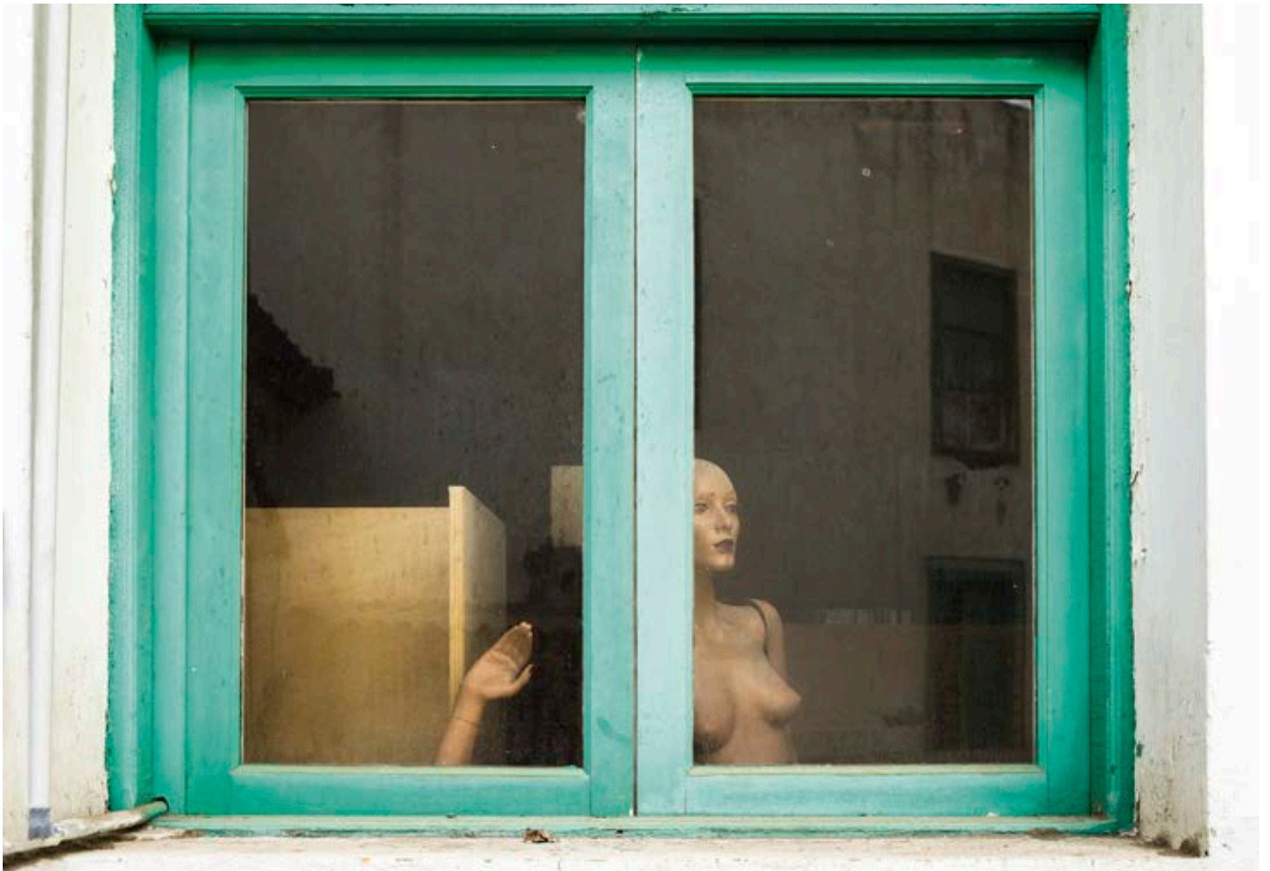
Maniquí asomado a la ventana (2011, Las Palmas. 150 x 112)