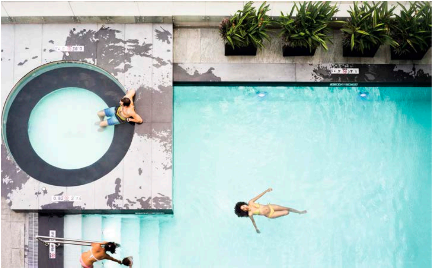
Flotando en la piscina (2013, Guayaquil. 180 x 112)