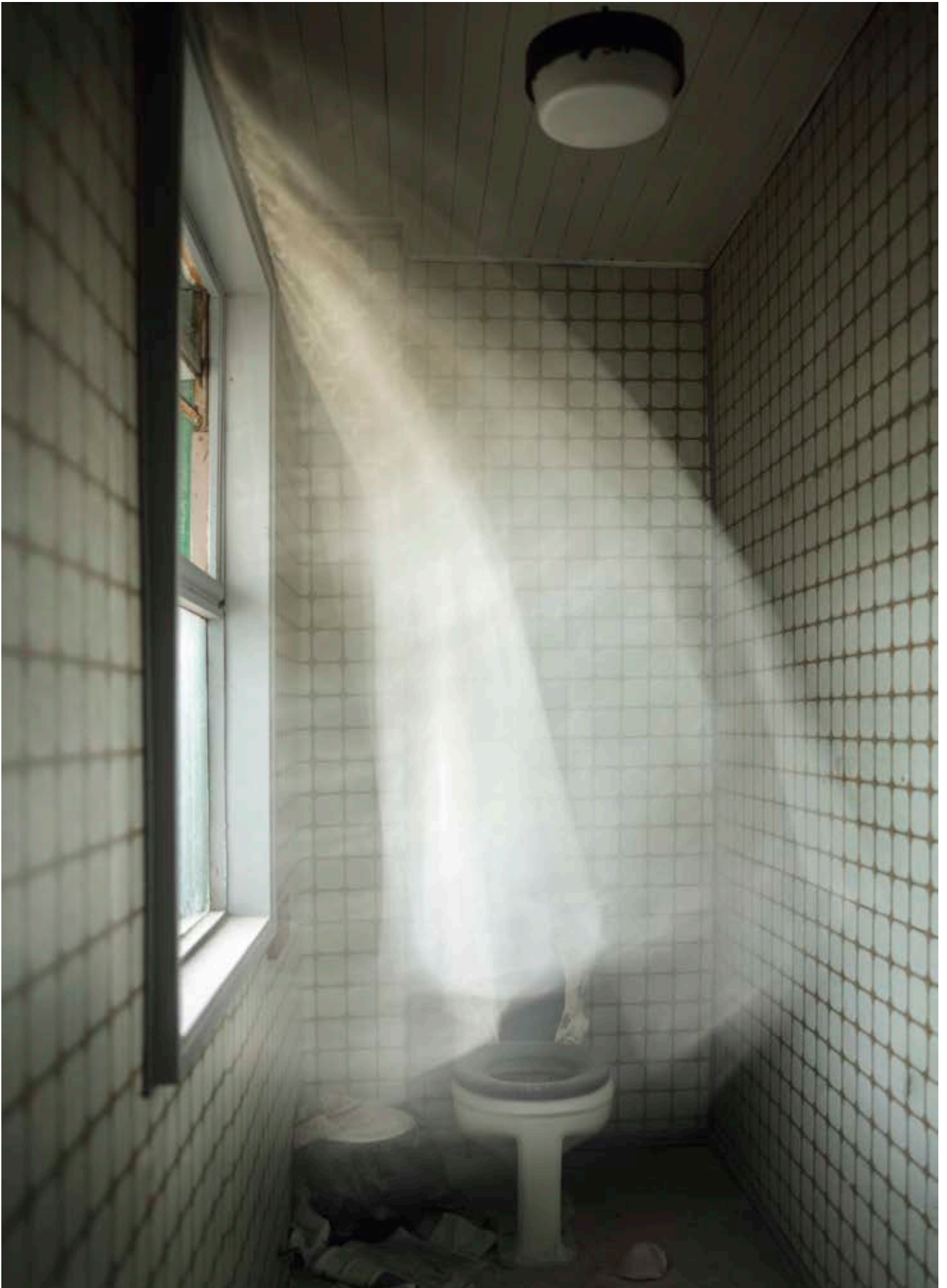
Cortina y baño (2012, Chile. 108 x 105)