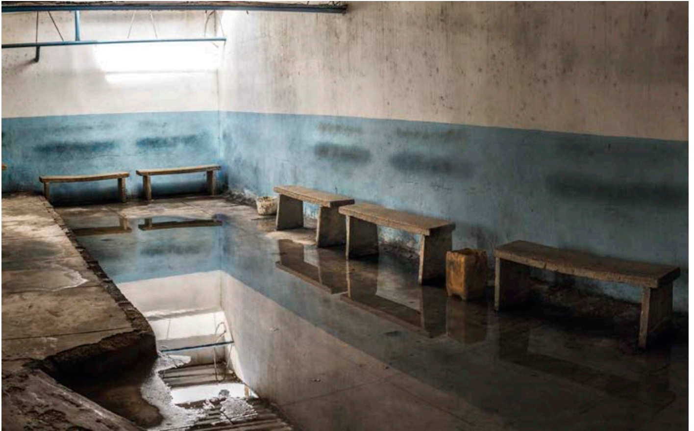
Sala de espera para cruzar a Regla (2013, La Habana. 150 x 94)