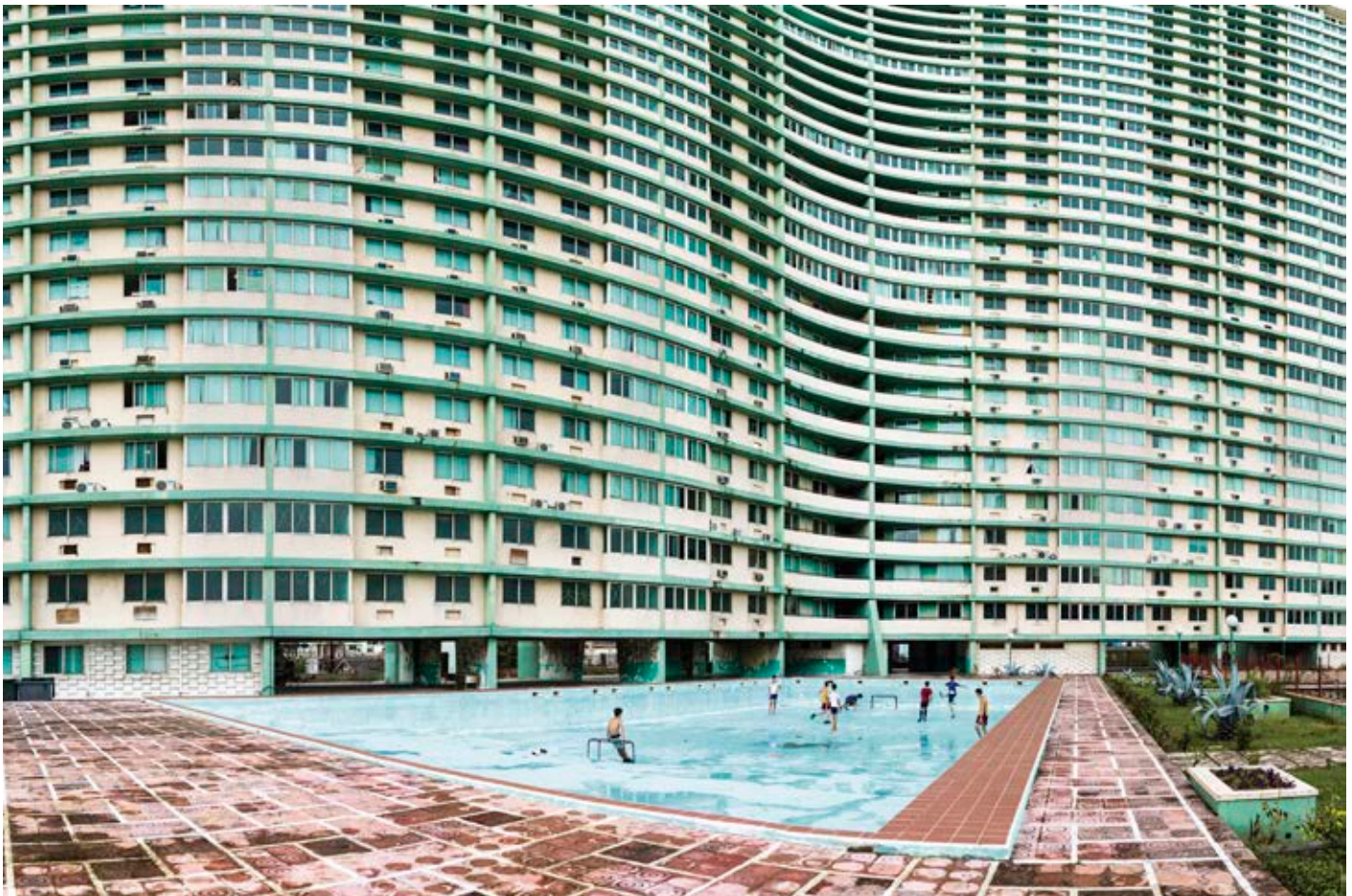
Fútbol en la piscina del Focsa (2015, La Habana. 225 x 150)